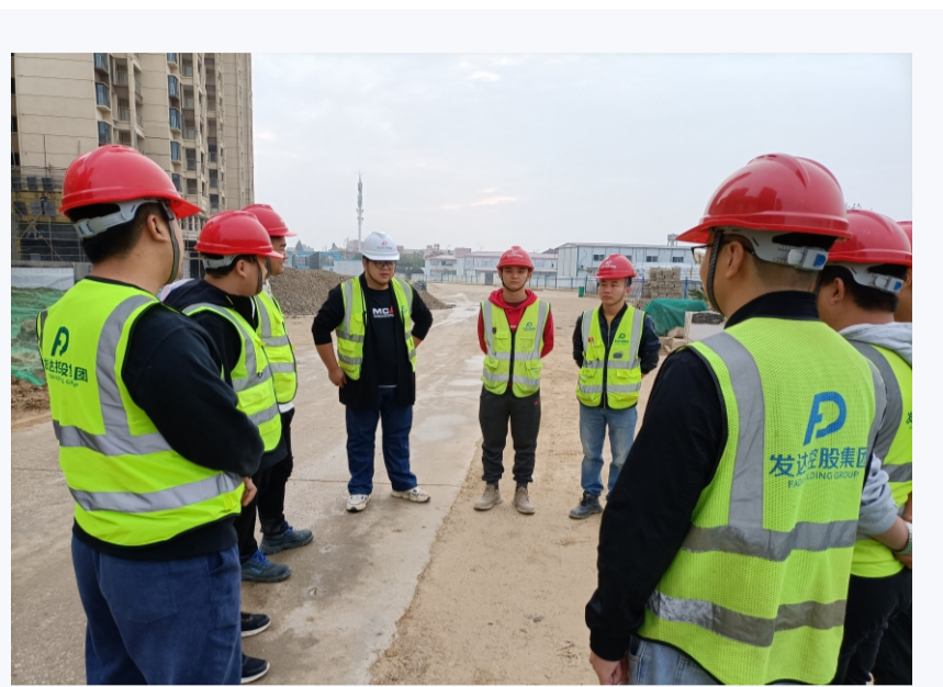
落实安全责任 推动安全发展

进场作业，不分昼夜制定工期计划，全面贯彻落实好建设任务。三是加强培训，严肃督查纠正。立即开展项目全面排查，健全防暑降温工作制度，分批组织各施工班组学习文件精神，以班组为小组做好高温期间安全生产教育培训，分发防暑降温用品。加强现场工程安全管控，严格要求外架搭设、支模架搭设等正在施工的工程按方案实施、检查、验收。加强防高坠事故发生，对每栋在建主体开展一次全面排查，现场楼层、洞口临边防护按要求搭设，安全通道、悬挑物料平台符合要求，加强现场作业人员佩戴安全防护用品。并积极开展消防检查，对民工住宿区、施工现场消防设施全面排查，认真组织安全管理人员执行每日排查制度，并形成每日记录存档查为日常施工保驾护航。